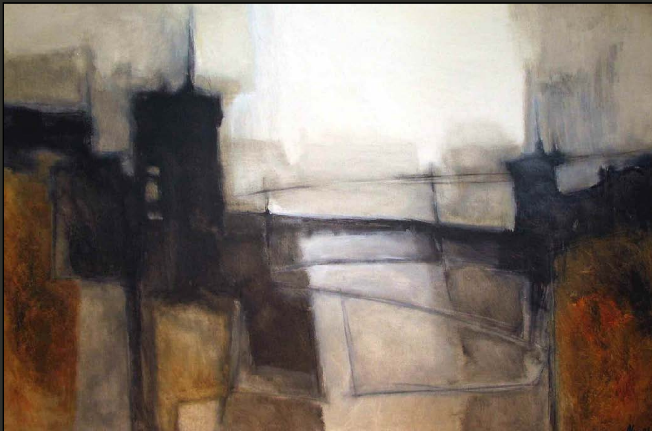
# titre année H" L" H cm Lcm 197 Le canal 2007 24 36 61,0 91,4