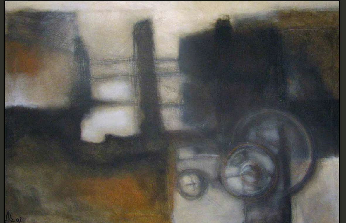
# titre année H" L" H cm Lcm 255 La frénésie industrielle 2007 24 36 61,0 91,4