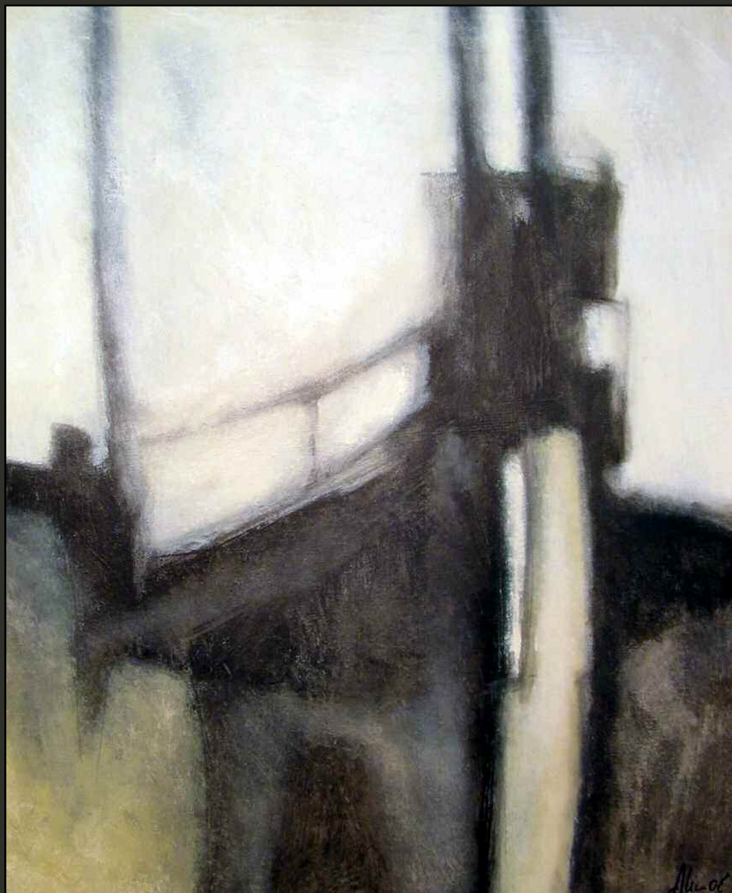
# titre année H" L" H cm Lcm 146 La passerelle de l'usine 2006 24 20 61,0 50,8