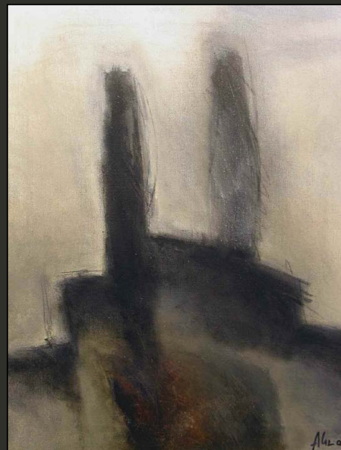
# titre année H" L" H cm Lcm 223 Cheminées en réflexion 2007 14 18 35,6 45,7