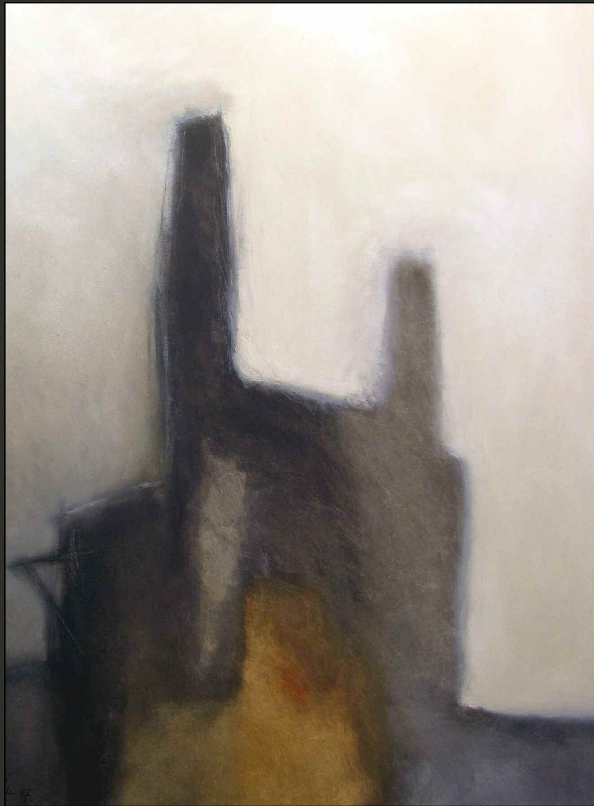
# titre année H" L" H cm Lcm 225 Cheminées en réflexion II 2007 40 30 101,6 76,2