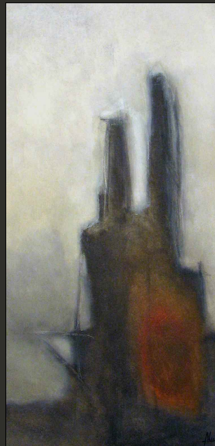
# titre année H" L" H cm Lcm 240 La petite usine verticale 2007 36 18 91,4 45,7