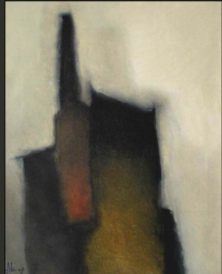
# titre année H" L" H cm Lcm 258 Petite usine gauche 2008 20 16 50,8 40,6