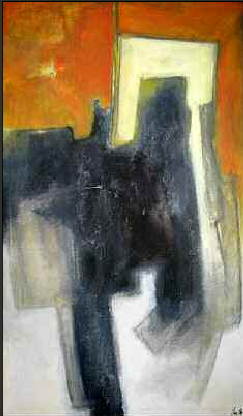
# titre année H" L" H cm Lcm 104 Rizières noires 2004 48 28 121,9 71,1