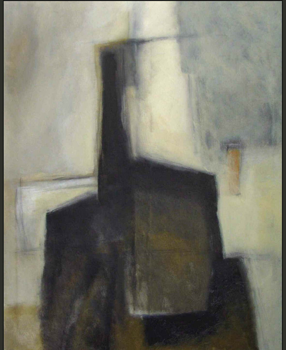
# titre année H" L" H cm Lcm 262 Usine soliloque 2008 30 24 76,2 61,0