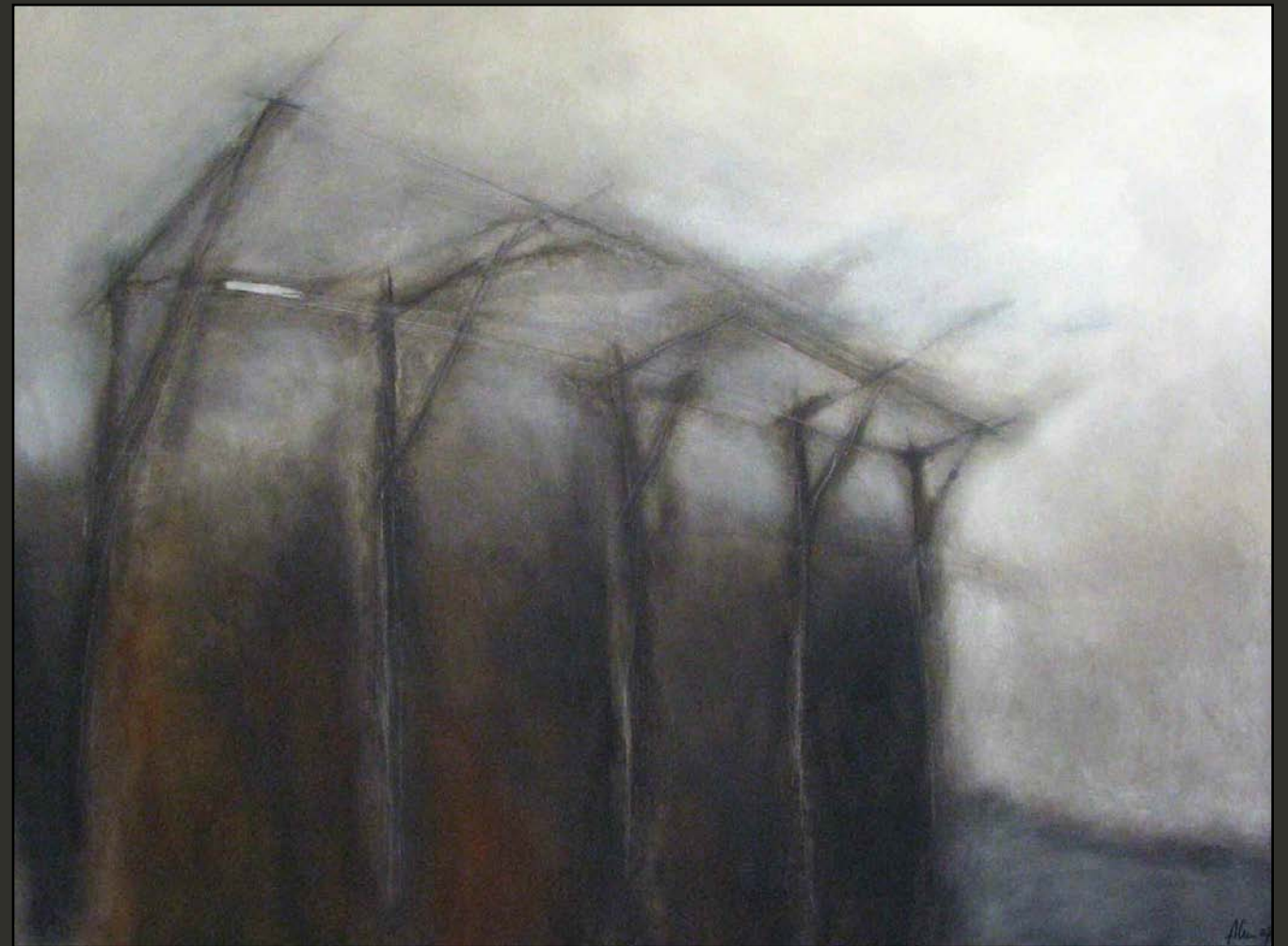
# titre année H" L" H cm Lcm 197 Le canal 2007 24 36 61,0 91,4