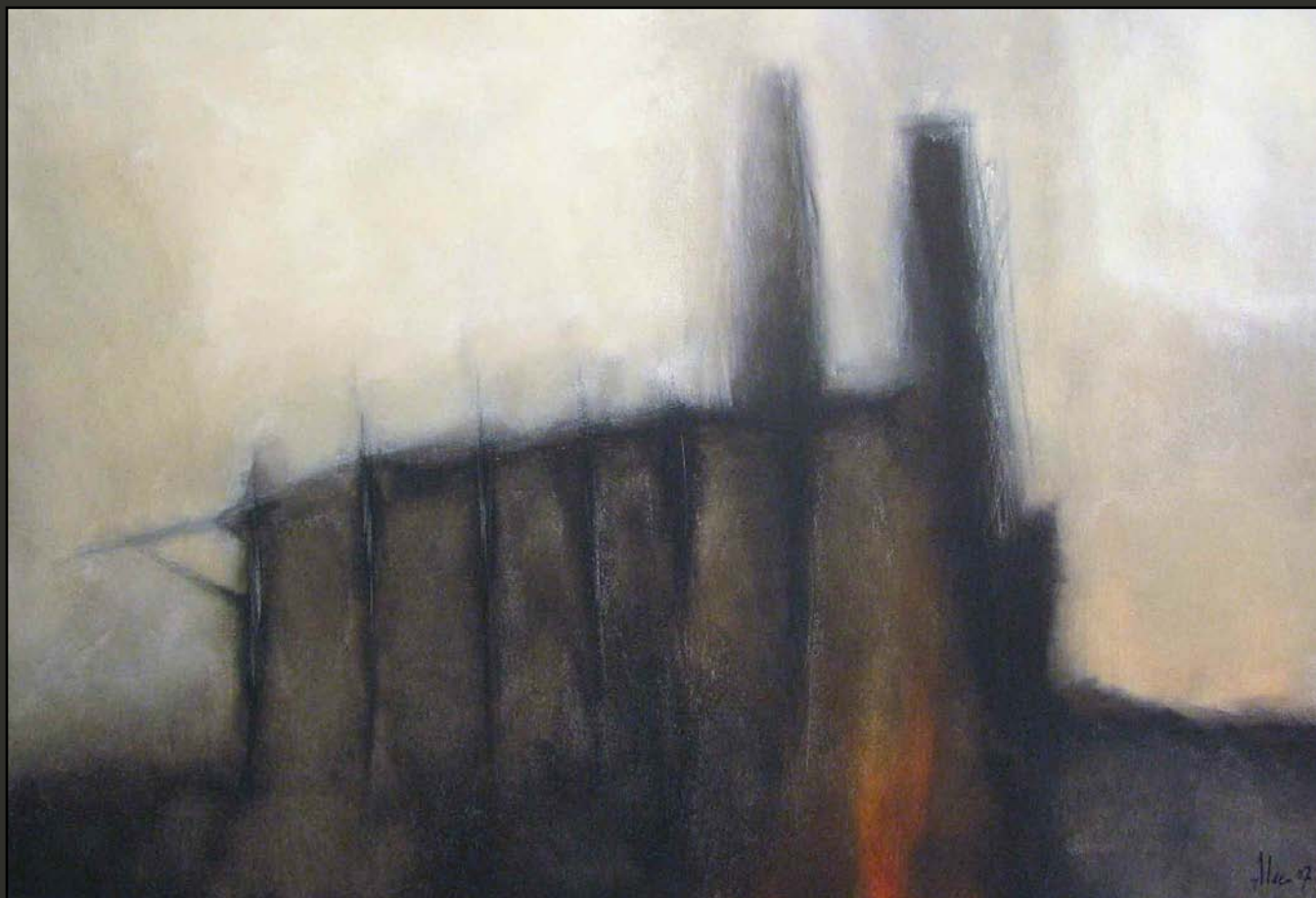
# titre année H" L" H cm Lcm 227 L'industrie cathédrale 2007 24 36 61,0 91,4