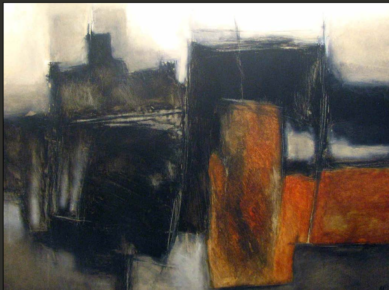
# titre année H" L" H cm Lcm 202 Urban Ground 2007 30 40 76,2 101,6