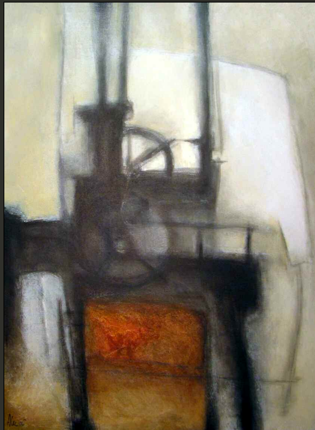
# titre année H" L" H cm Lcm 150 La fournaise 2006 36 24 91,4 61,0