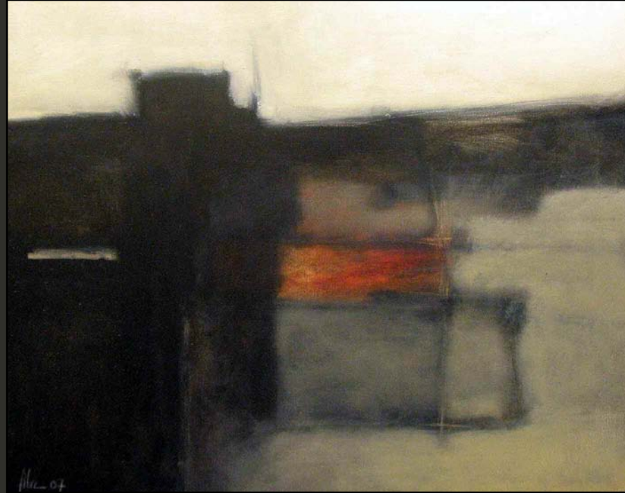
# titre année H" L" H cm Lcm 204 Les rizières d'huiles 2007 16 20 40,6 50,8