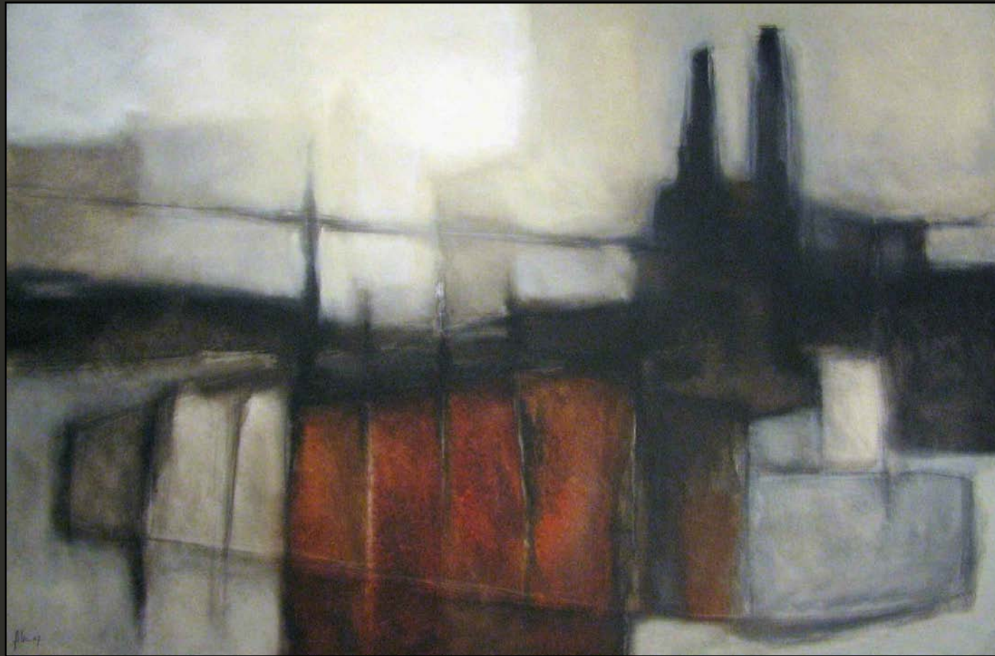
# titre année H" L" H cm Lcm 239 La géante rouge 2007 48 72 121,9 182,9