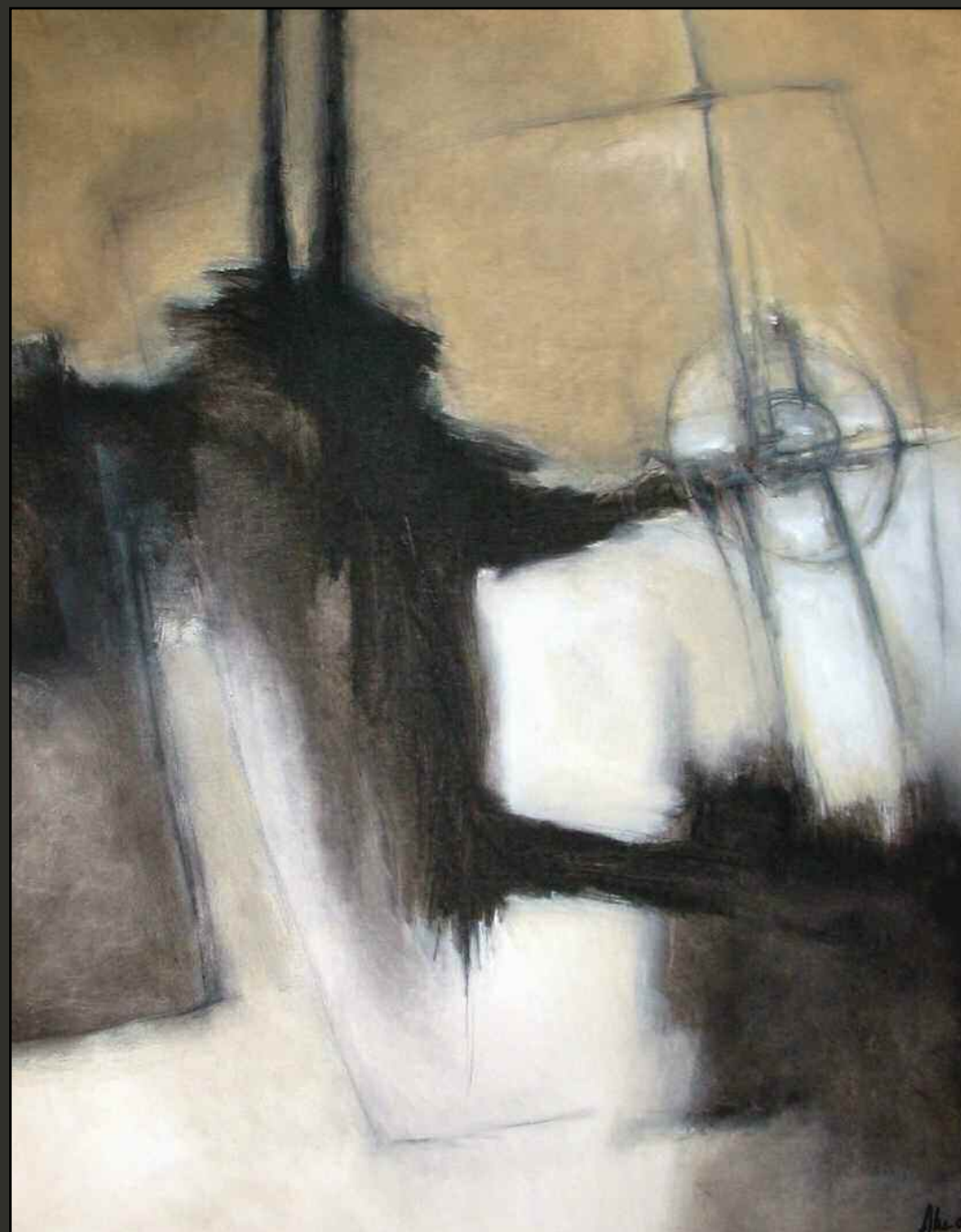
# titre année H" L" H cm Lcm 181 Mine de charbon en Sibirie 2006 30 24 76,2 61,0