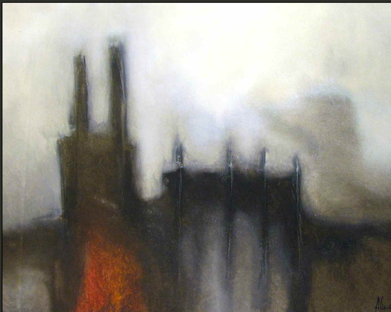
# titre année H" L" H cm Lcm 233 De feu et de cendres 2007 22 28 55,9 71,1