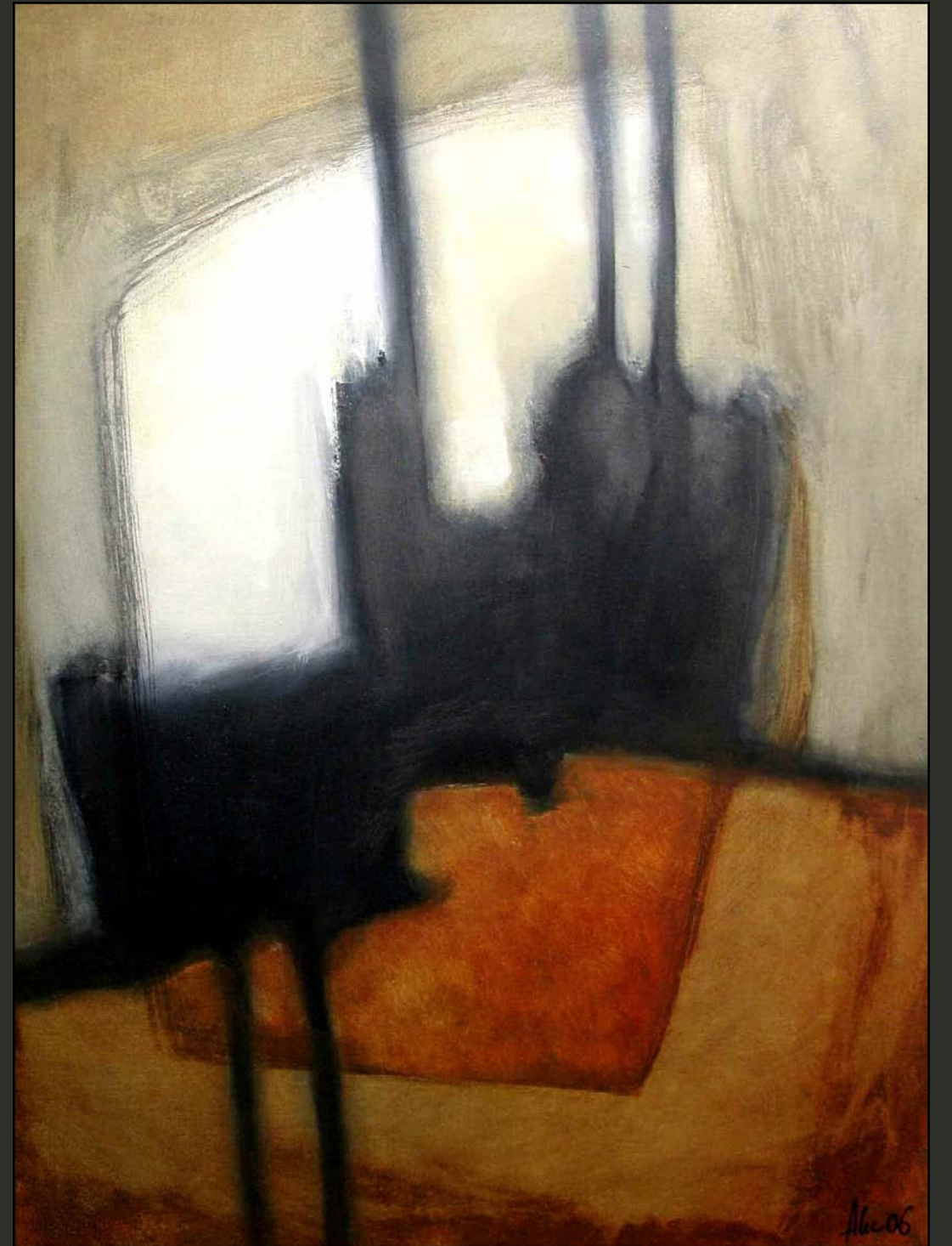
# titre année H" L" H cm Lcm 126 La vieille usine 2006 32 24 81,3 61,0