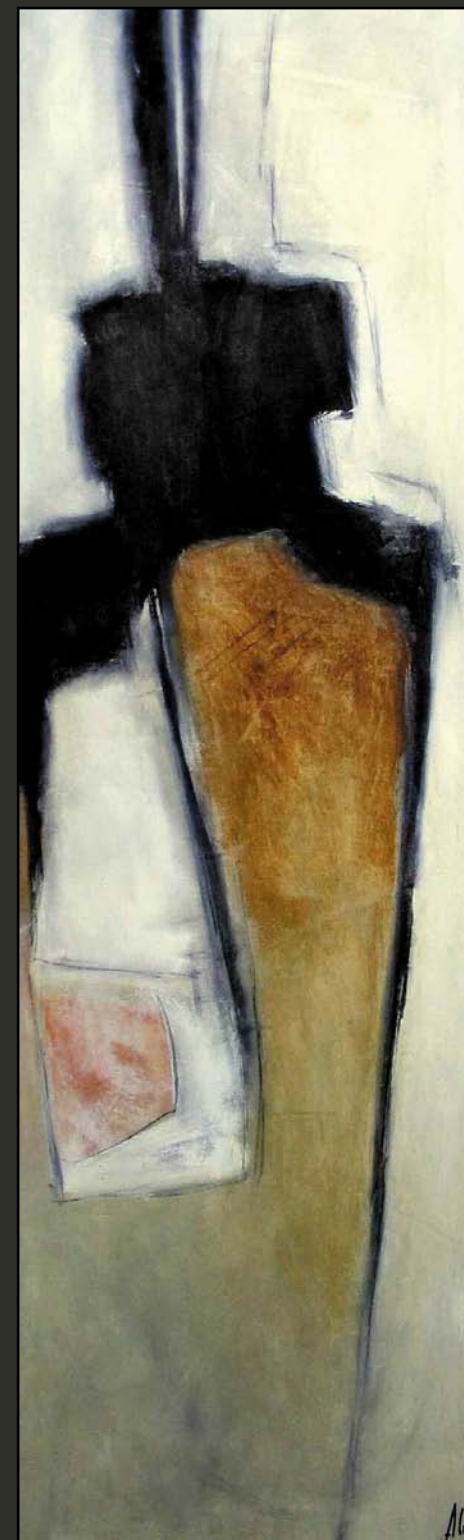
# titre année H" L" H cm Lcm 148 Tripode 2006 50 16 127,0 40,6