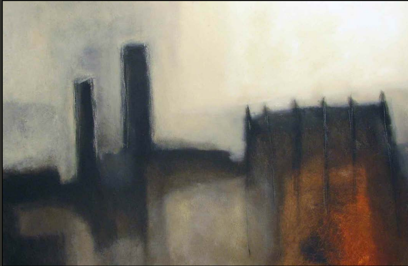
# titre année H" L" H cm Lcm 228 Fin de journée 2007 24 36 61,0 91,4