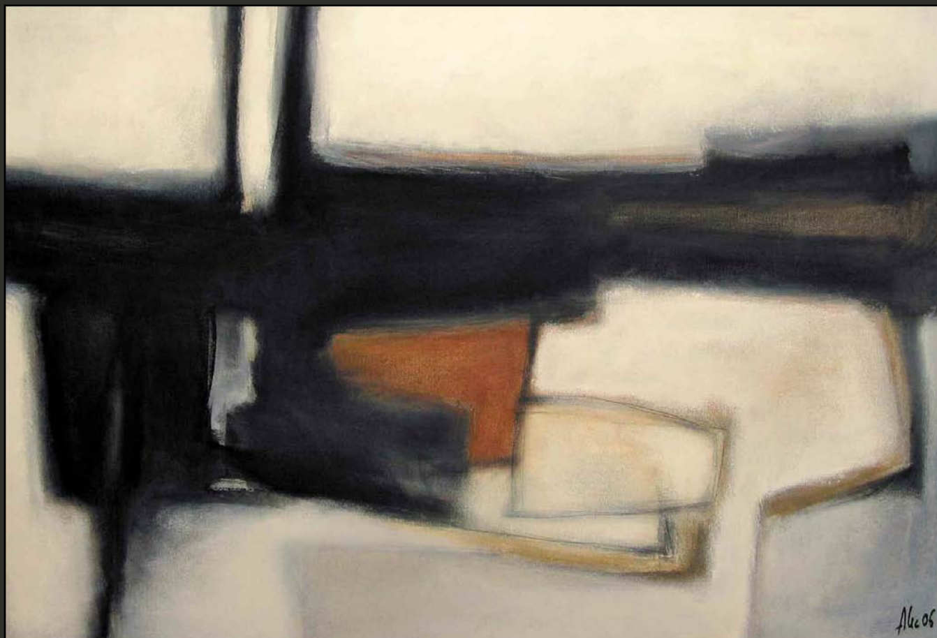
# titre année H" L" H cm Lcm 119 Terres noires 2006 26 38 66,0 96,5