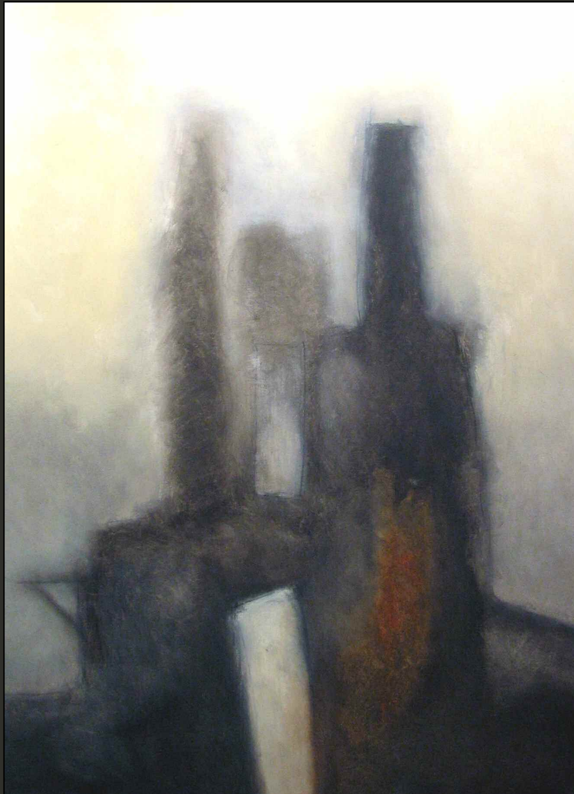
# titre année H" L" H cm Lcm 218 Usine 2007 48 36 121,9 91,4